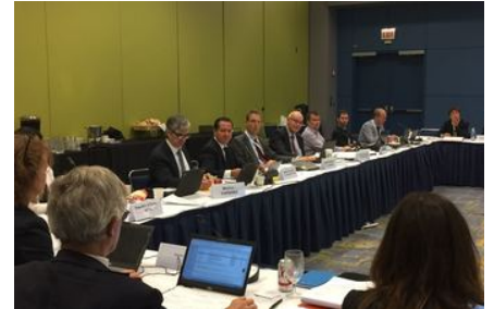
PARTICIPA MÉXICO COMO VICEPRESIDENTE EN REUNIÓN INTERNACIONAL DE AGENCIAS REGULADORAS

Cabe recordar que en octubre del año pasado la ICMRA nombró por unanimidad a México para ocupar la Vicepresidencia de este organismo para el periodo 2016-2018, como un reconocimiento a la labor realizada por nuestro país en materia de regulación.